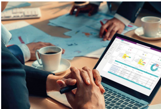
ISMS- bzw. GRC-Software leistet einen Beitrag zur Steigerung von Effizienz und Effektivität in Informationssicherheitsmanagementsystemen.