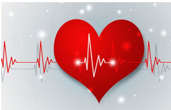
Die Swiss Infosec und Swiss GRC Heartbeat-Umfrage fühlt den Puls zu aktuellen Themen