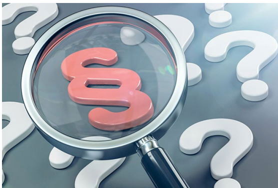
Informationssicherheitsgesetz des Bundes (ISG)